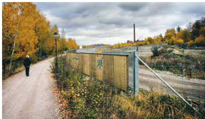
Här i Hjorthagen ska nya stadsdelen Norra Djurgårdsstaden byggas.