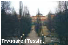
Tryggare i Tessin.