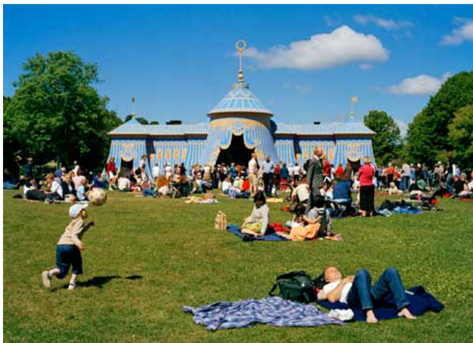
Koppartälten med pelousen. Här finns scenen med uppträdanden och tal.

13.00–14.30 Mat till fest & vardag i 1700-talets Haga – Åke Livstedt.